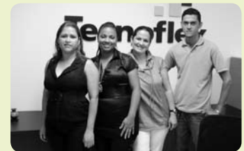
Equipe In Office