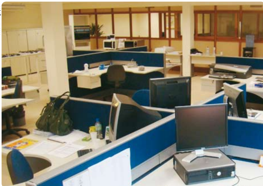
A linha Job permite uma melhor individualização dos postos de trabalhos